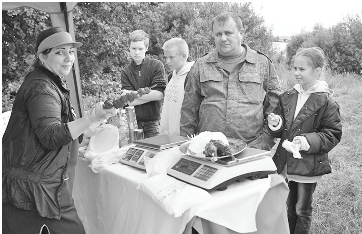
Шашлык был хорош!