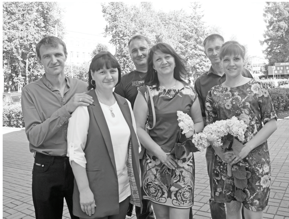
Молодые, активные, дружные семьи нашего района.