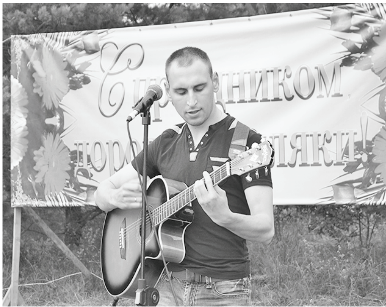
Природа, гитара, хорошая песня...

Но ведь из каждого правила есть исключения. Незнакомый дядя решил попробовать червя. Ведь он универсален, и на него тоже может клюнуть Его величество Карп. Мы затеяли бесе-